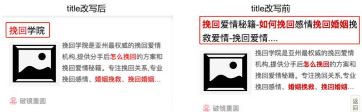
图 4-1 针对标题堆砌问题的改写示例