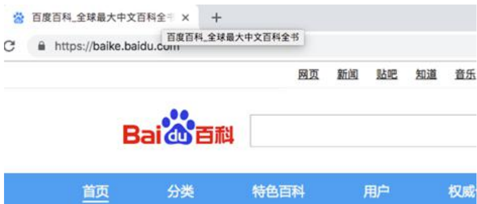
图 1-1 符合规范的标题示例