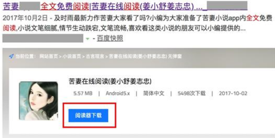
图 3-2 标题标明可下载小说，但页面中诱导下载 APP 的负面案例